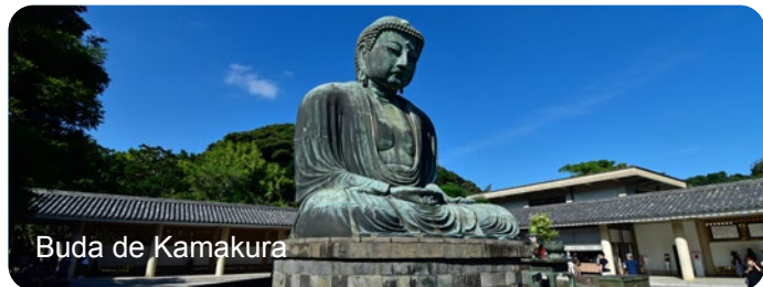
Buda de Kamakura

16 Agosto – Visita a Kamakura e embarque.