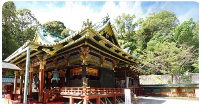
Shimizu, Japão 25 de agosto de 2026

Preço desde Adulto desde 123€ Criança desde 116€