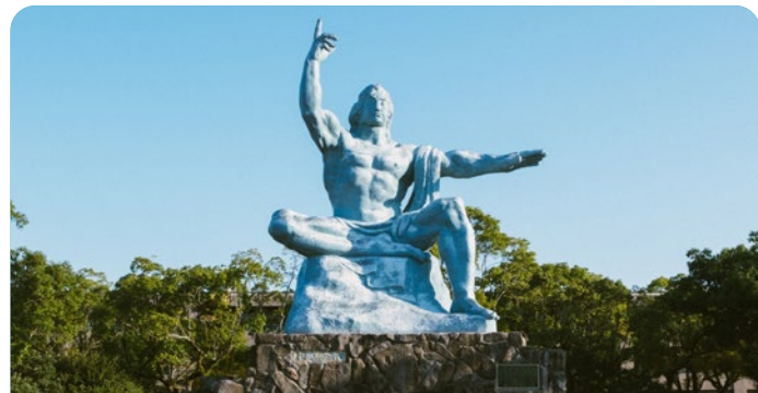
Nagasaki, Japão 22 de agosto de 2026

Preço desde Adulto desde 92€ Criança desde 70€