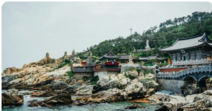
Busan, Coreia do Sul 21 de agosto de 2026