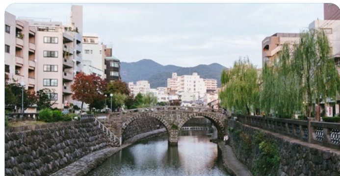
Kochi, Japão 19 de agosto de 2026

Preço desde Adulto desde 113€ Criança desde 94€