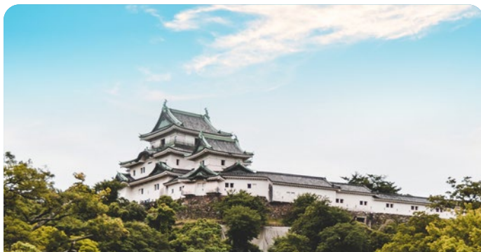
Wakayama (desde Shimotsu), Japão 18 de agosto de 2026